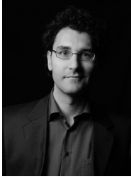
Ερμής Θεοδωράκης - πιάνο